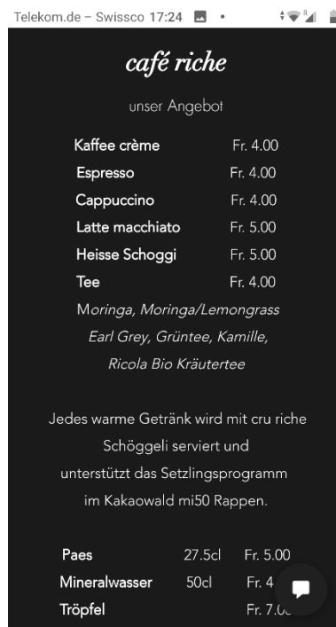
Aktuell: heisse Schoggi im café riche für CHF 5.— (auch vegan erhältlich)