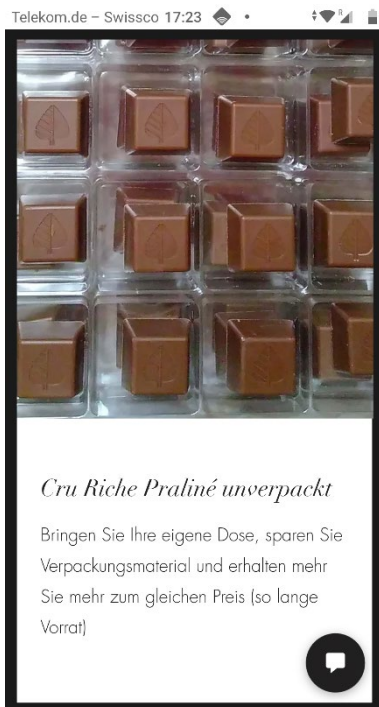
Praliné unverpackt 100g CHF 7.50 (so lange Vorrat)

Ihre Bestellung wird auch weiterhin dankend per e-mail oder per Telefon entgegen genommen.